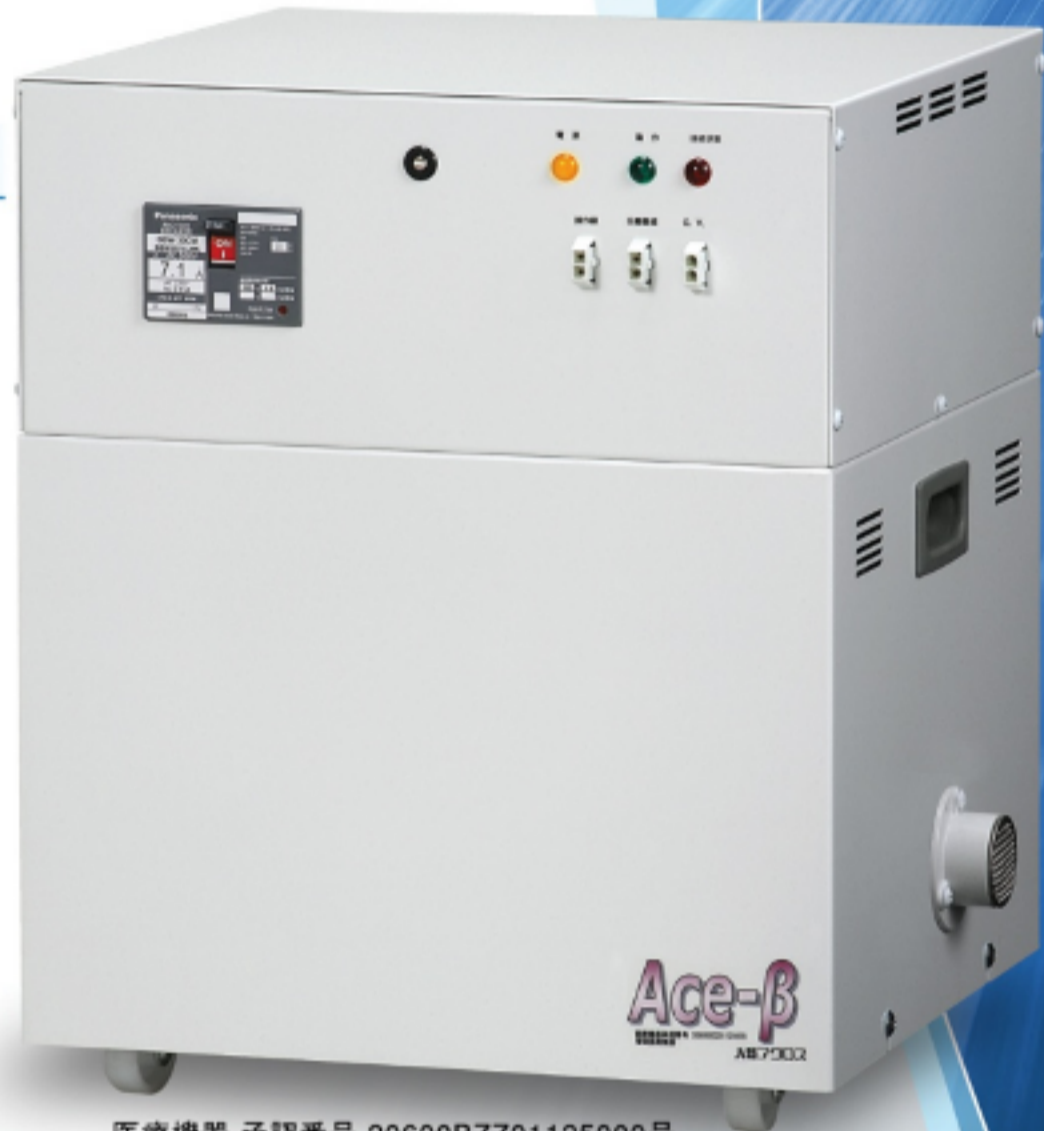
医療機器 承認番号 20600BZZ01125000号