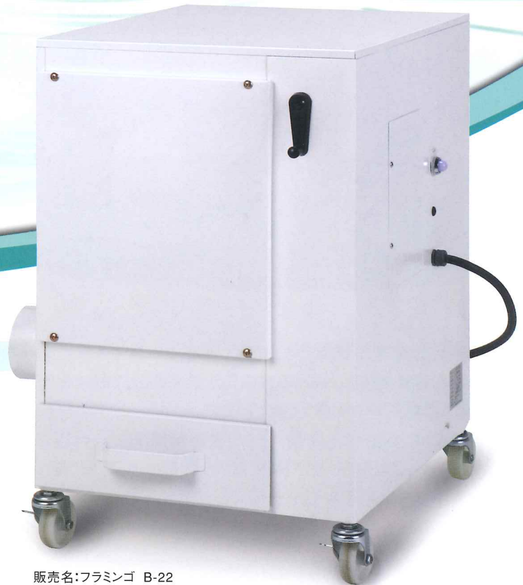
販売名: フラミンゴ B-22 医療機器 認証番号 221AGBZX00100000