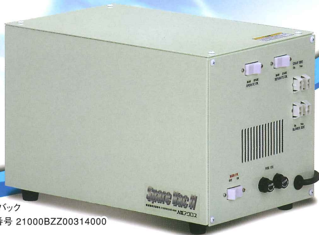
販売名:スペア・バック 医療機器 承認番号 21000BZZ00314000