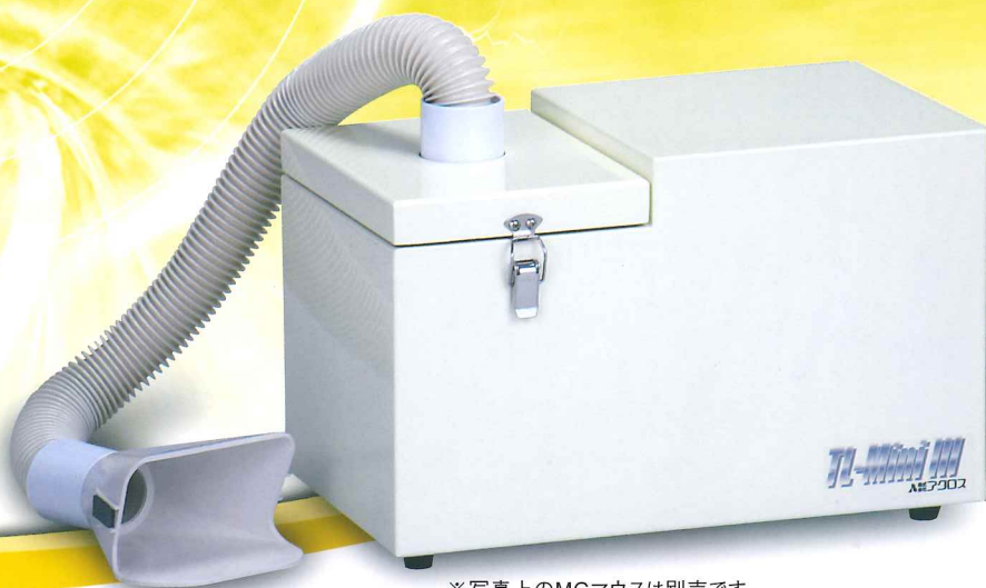
※写真上のMGマウスは別売です。